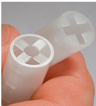
Begge ender kan anvendes.