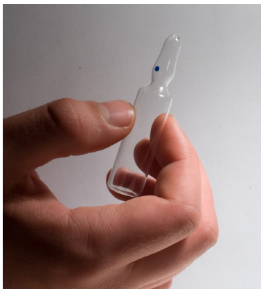
AmpSnap® passer til ampuller på 1-10 ml.